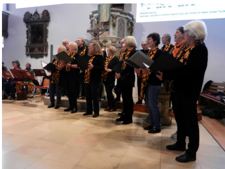
Le chœur « TonArt 7 » et le groupe musical « Taktzente » lors du culte à Stetten

Le dimanche de Yenfaabima annuel du 23 octobre était à nouveau prévu comme événement simultané à Stetten et à Piéla. Cette année encore, une connexion en direct avec Piéla était prévue. Là aussi, au même moment, un culte et le même texte de prédication devaient mettre l'accent sur notre partenariats. Après la destruction d'un antenne de téléphonie mobile par des terroristes dans la région de Piéla la semaine précédente, Tankpari a pris la parole depuis le sommet du château d'eau lors de la séance d'essai. À ce moment c'était le seul endroit possible pour une connexion Internet. Le programme prévu à Piéla a été modifié en un clin d'œil. Au lieu d'une interview dans la salle de culte, il s'agissait de transmettre une vue panoramique du site avec des explications sur les bâtiments, le jardin et les activités sur le site. Malheureusement, le signal était très faible et aucune connexion n'a pu être établie pendant le culte.