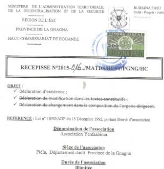
La déclaration d'existence de l'Association Yenfaabima