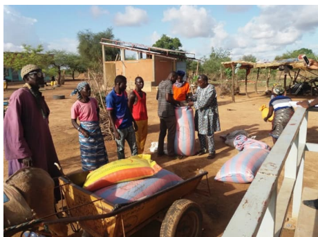
23 sacs de maïs, 17 sacs de riz et 7 sacs de mil sont distribués aux personnes démunies et utilisés pour nourrir les patients sur le site de Yenfaabima.